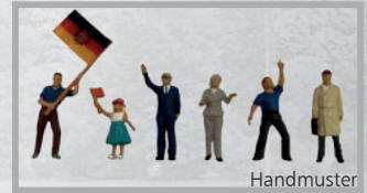
Diesem Set liegt ein 6teiliger Figurensatz bei.

Dieses Set enthält den Salonwagen B mit Küche 61 50 89-80 010-1, den Salonspeisewagen mit Küche 61 50 88-80 053-2, sowie den Maschinen-Gepäckwagen 61 50 92-80 203-7.